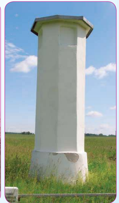
Merkinės miesto stulpas