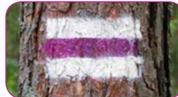
Ši trasa pažymėta taip