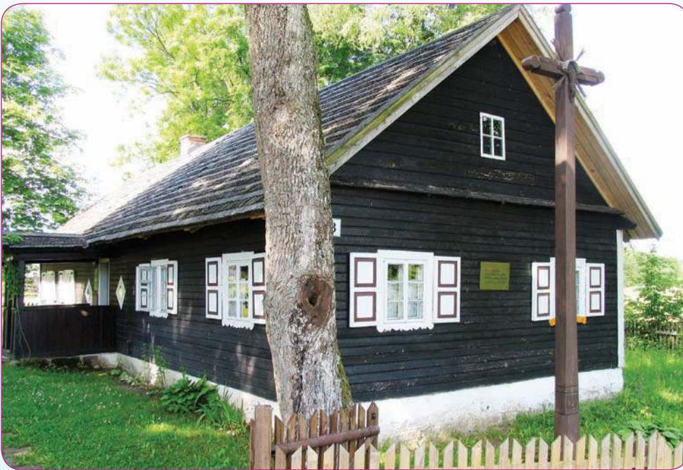
Vinco Krėvės-Mickevičiaus muziejus

Žygį baigsime ir jėgas atgausime ant Merkinės piliakalnio . Nuo čia atsiveria nuostabus vaizdas į Nemuno ir Merčio santaką .