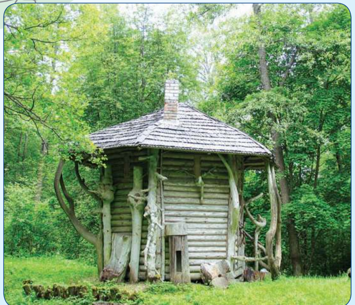
A. Matučio drevė